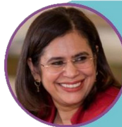
Rixi Romana Moncada Godoy

Es una abogada y política hondureña. Fue ministra de trabajo y gerente de la Empresa Nacional de Energía Eléctrica (ENEE), actualmente se desempeña como Ministra de la Secretaría de Finanzas (Sefin)