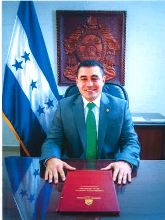
Abg. Abraham Alvarenga Urbina Procurador General de la República

El Plan Operativo Anual 2016, es una herramienta de mucha importancia para la Procuraduría General de la República (PGR), establece una planificación detallada de acciones operativas y estratégicas para cada una de las Direcciones, Gerencias, Departamentos y Unidades de la PGR, orientadas al cumplimiento de metas y objetivos institucionales y contribuir así al cumplimiento del mandato constitucional de “Ejercer la Representación Legal del Estado de Honduras”.